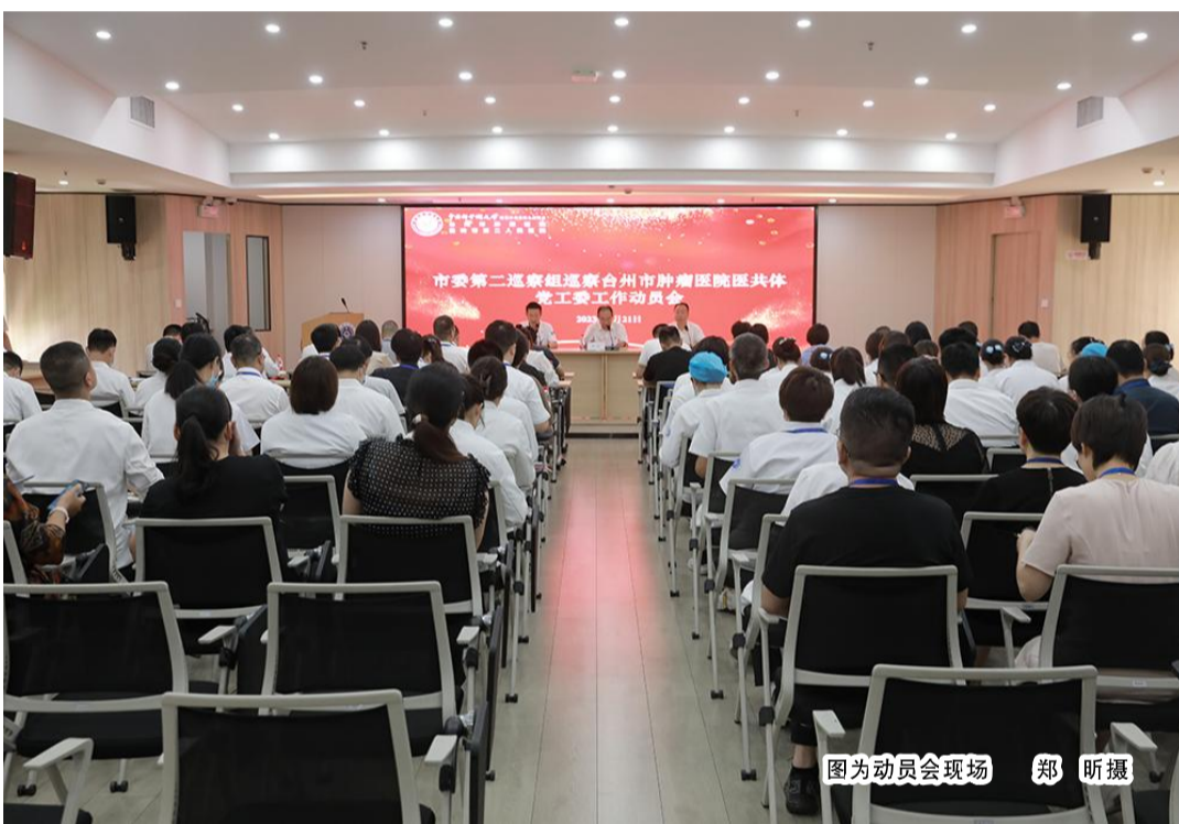
图为动员会现场