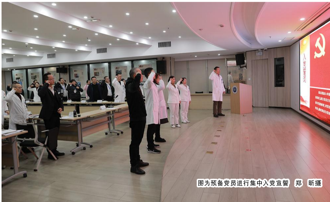
图为预备党员进行集中入党宣誓

本报讯(记者 郑昕 通讯员 陈辉军)12月19日,台州市肿瘤医院医共体举行2023年全面